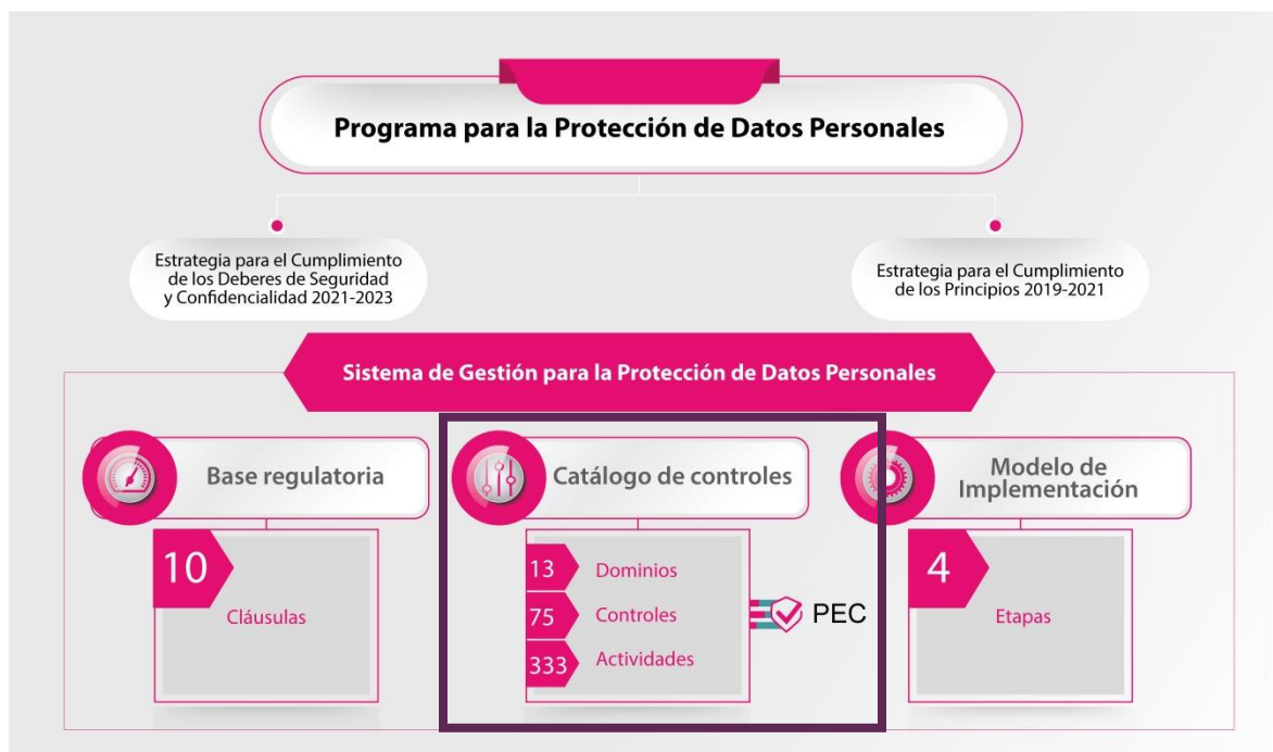
Imagen 1. Modelo de Protección de Datos Personales del Instituto Nacional Electoral con énfasis en el Sistema de Gestión y el PEC.

informática 3 a través de la cual se dará seguimiento a la implementación del Catálogo de Controles de manera documentada, sistematizada, estructurada, repetible, eficiente y adaptada al entorno institucional, como se muestra en la Imagen 1.