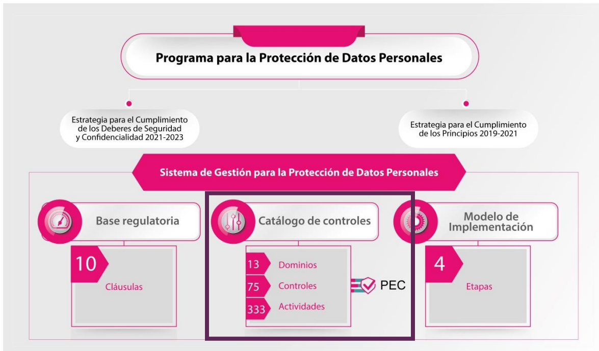
Imagen 1. Modelo de Protección de Datos Personales del Instituto Nacional Electoral con énfasis en el Sistema de Gestión y el PEC.

informática 3 a través de la cual se dará seguimiento a la implementación del Catálogo de Controles de manera documentada, sistematizada, estructurada, repetible, eficiente y adaptada al entorno institucional, como se muestra en la Imagen 1.